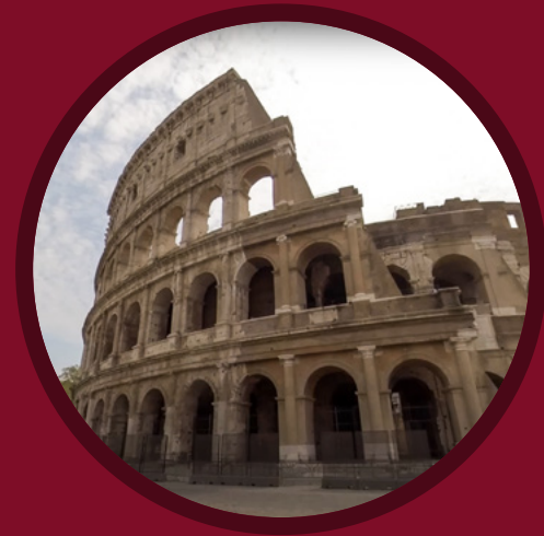
RAI 360 5 CITTÀ ROMA