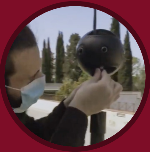
TEASER BACKSTAGE LOCKDOWN 2020