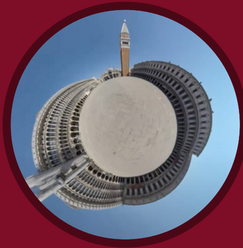
RAI 2D MINIVIDEOS